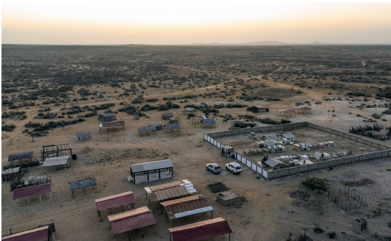
Cementerio Wayuu

ha pronunciado ante este tipo de casos, manifestando que no se ha incluido en la base de datos, ya que han sido originados por divisiones y esto puede escalar a disputas por territorio (Corte Constitucional 2019).