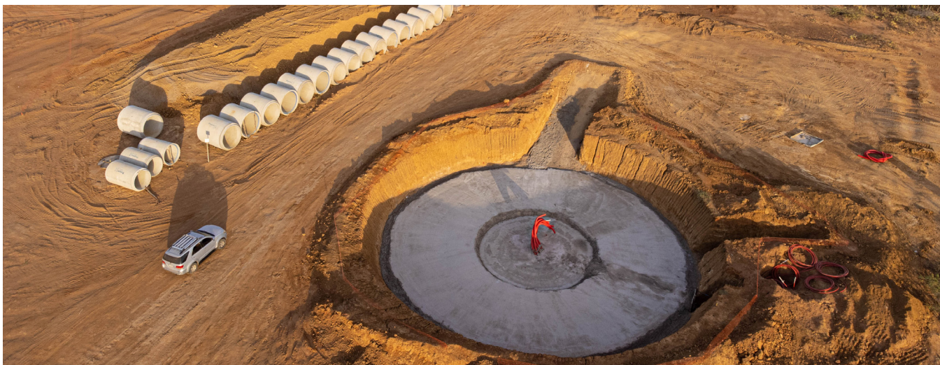
Base de aerogenerador del parque eólico Windpeshi. En 2023 la construcción de Windpeshi fue suspendida

Aunque este aumento transferencias es señalado como un habilitador social de la transición energética, ha generado un debate en torno a las cargas adicionales que posa sobre las empresas desarrolladoras (Energía Estratégica 2023b) y existen serias dudas sobre la vigilancia y ejecución efectiva de estos recursos en el contexto de corrupción local en La Guajira y limitada planificación. Aunque históricamente las transferencias eléctricas juegan un papel importante en la financiación de entidades y municipios, una problemática evidente ha sido la gestión de estos recursos debido a las ineficiencias en su incorporación y su uso ineficiente dentro de los presupuestos locales (Vélez Gómez y Vélez Henao 2014).