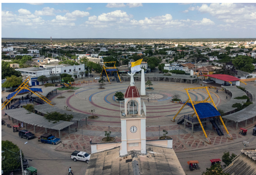
Plaza central del municipio de Uribe, La Guajira. Al fondo la alcaldía municipal

Se puede afirmar que el desarrollo de los proyectos eólicos en La Guajira ha seguido el modelo Decidir- Anunciar-Defender (DAD) (Devine-Wright 2014) donde las decisiones minero-energéticas son simplemente comunicadas al público. Como evidencia de esto, el gobierno nacional llevo a cabo subastas antes de llegar a un acuerdo final con las comunidades donde se construirán los proyectos y publicó la hoja de ruta para el desarrollo eólico offshore sin surtir el proceso de consulta con comunidades locales. 12 En ese sentido, es preciso armonizar la planeación minero-energética con los instrumentos de planeación subnacionales para una mayor claridad sobre donde pueden ocurrir los proyectos y donde tienen importantes efectos adversos sobre el medio ambiente y las comunidades locales que no pueden ser mitigados o gestionados, y evitar tanto la conflictividad como la competencia con otros sectores económicos.