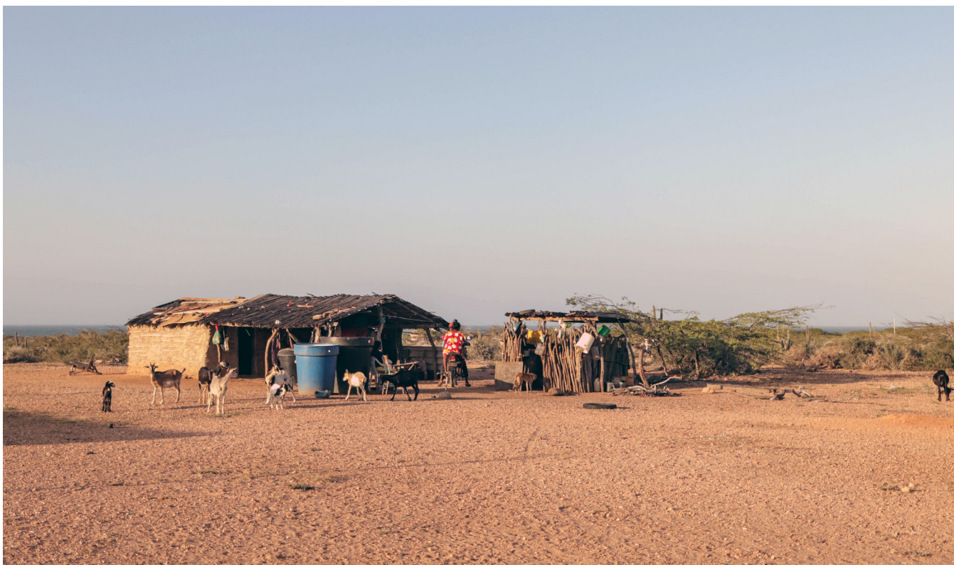
Ranchería Wayuu

corrupción estatal e inestabilidad institucional, y alarmantes cifras de desnutrición infantil (Corte Constitucional 2017; DANE s. f.; UPME 2019). De hecho, en La Guajira se ha declarado un estado de cosas inconstitucional 6 en relación con el goce efectivo de derechos básicos, incluyendo los derechos de autodeterminación y a la participación de las comunidades Wayuu (Corte Constitucional 2017). Además, el establecimiento de los sectores económicos extractivos ha ocurrido sin considerar una conexión con la identidad, forma de vida y cultura del pueblo Wayuu (Guerra 2022) y ha generado un legado de impactos socioambientales sin resolver, especialmente la minería de carbón térmico (López y Patzy 2021; Yanguas Parra et al. 2021).