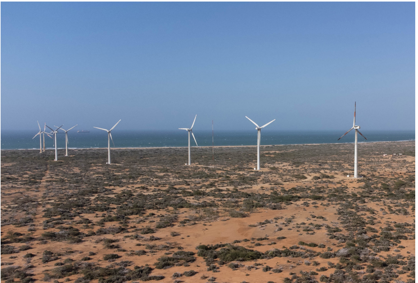
Parque eólico Jeparachi, próximo a ser desmantelado

Reducir las desigualdades de información es uno de los factores esenciales para tomar decisiones justas y oportunas, al mismo tiempo que se construye confianza, legitimidad y se fomentan discusiones públicas mejor informadas. El acceso oportuno a información se ha convertido en un desafío para comunidades y empresas desarrolladoras, también para actores desde la academia, el resto del sector privado y las administraciones públicas (Mejía 2023; Transparencia por Colombia 2023). El desconocimiento de aspectos como la cantidad de proyectos, su capacidad, las áreas reales a intervenir, información de los desarrolladores y contratistas, los Estudios de Impacto Ambiental (EIA), estudios etnográficos de las comunidades locales, y demás características intrínsecas a cada proyecto representa una barrera para una participación efectiva y vislumbrar sus impactos tanto positivos como negativos (Ver Cuadro 3). Se trata de fortalecer el flujo de información en varias vías en términos de información sobre los proyectos, pero también sobre las comunidades locales.