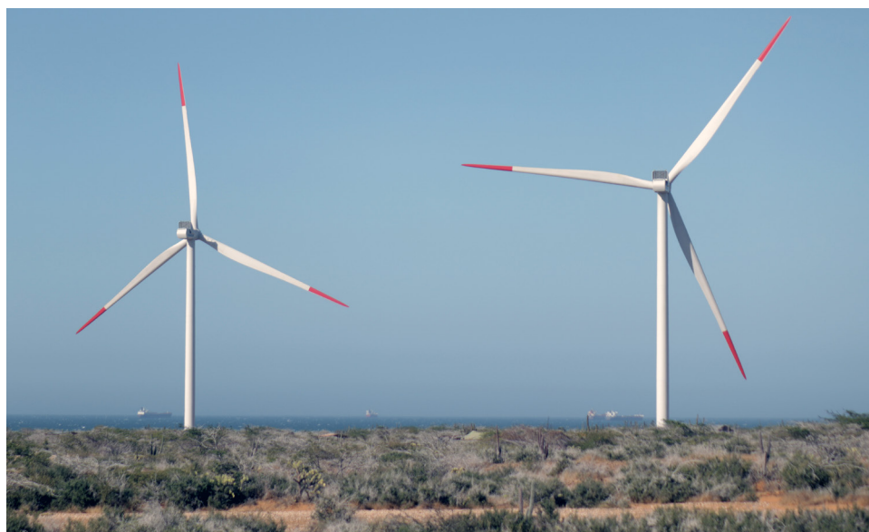
Parque eólico WESP 01 y, al fondo, buques carboneros

Por otro lado, se ha evidenciado que a medida que los mercados se desarrollan, el crecimiento del sector de fabricación de energía eólica y los sectores de servicios relacionados pueden desempeñar un papel clave en el mantenimiento del apoyo social y político a la industria (GWEC 2023). Este crecimiento en la cadena de valor de la energía eólica ya se está manifestando en La Guajira con el establecimiento de plantas de fabricación de torres de hormigón (Energía Estratégica 2023a) lo que implica considerar acciones concretas en los instrumentos de planeación del territorio para articular con estas actividades.