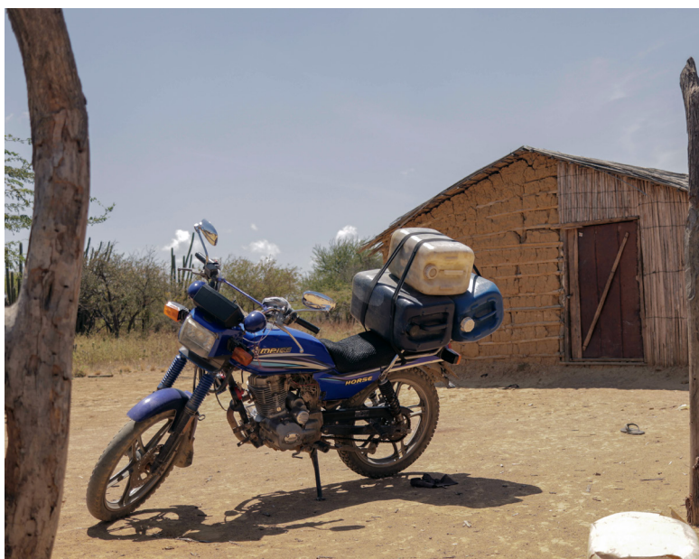
Motocicleta en ranchería Wayuu

Las transferencias eléctricas son recursos que las empresas generadoras de energía eléctrica en Colombia están obligadas a transferir a las entidades territoriales donde están ubicadas las plantas según la regulación disponga y de acuerdo con la tarifa que señale la Comisión de Energía y Gas (CREG). Para las plantas eólicas, según la Ley 2294 de 2023, estas transferencias aumentarán gradualmente del 1% al 6% en el caso de las plantas nuevas y al 4% para las plantas en operación (Congreso de Colombia 2023). Esto aplica únicamente para plantas ubicadas en áreas de mayor velocidad promedio del viento (mayores a 4 m/s a 10m de altura) como La Guajira y, según la Ley, los recursos serán destinados a la financiación de proyectos definidos por las comunidades étnicas en el área de influencia de los proyectos.