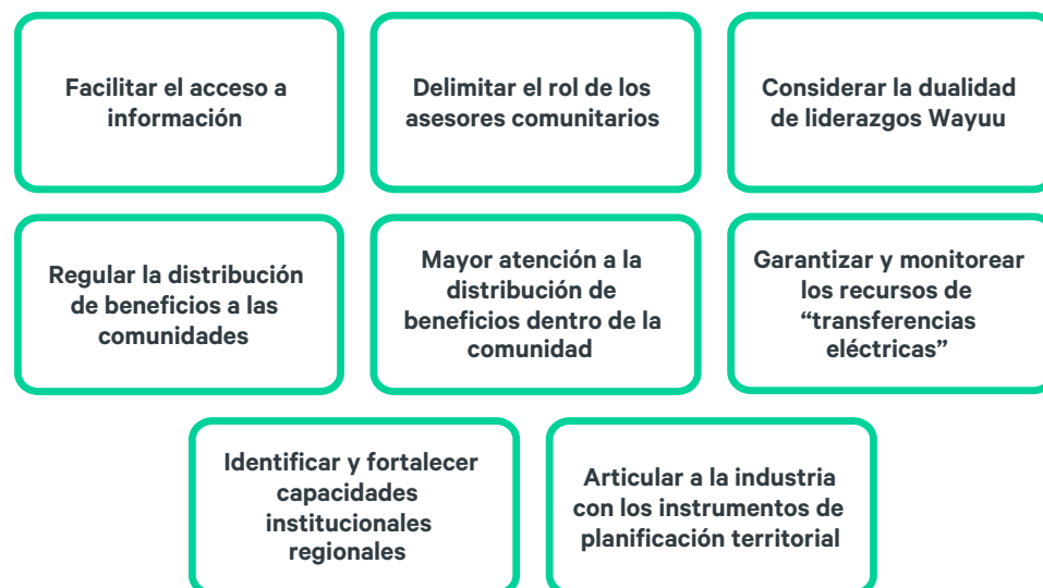
Figura 2. Factores habilitantes de la aceptación social de los proyectos eólicos en La Guajira

Abordar estos factores debe entenderse desde una perspectiva de responsabilidades compartidas entre los diferentes actores del territorio. Estos factores son aspectos prácticos que deben considerarse para cumplir con los compromisos expuestos en el pacto por la transición energética justa en La Guajira “ La Guajira 2050, un territorio de vida para todas y todos ” (Ministerio de Minas y Energía 2023a) y la elaboración de la hoja de ruta de la Transición Energética Justa en Colombia (Ministerio de Minas y Energía 2023).