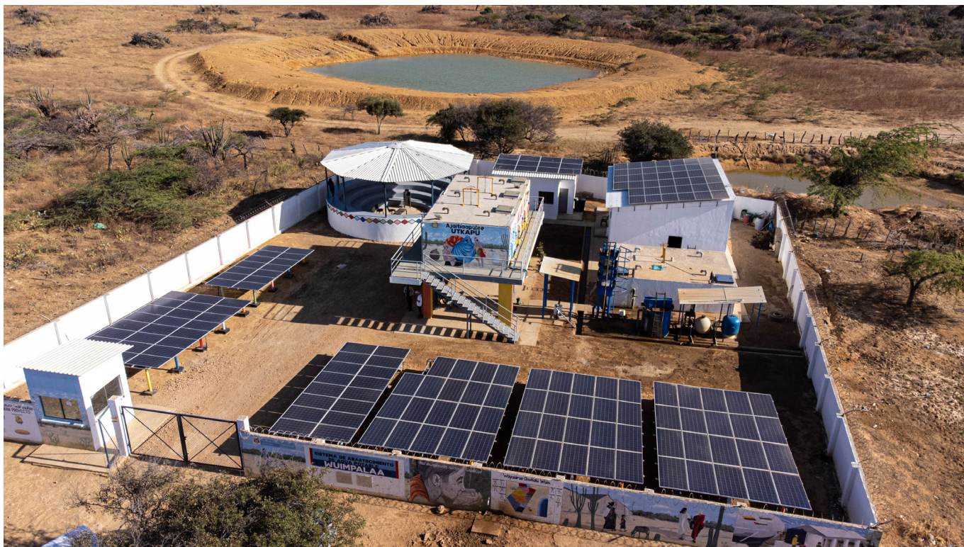
Microacueducto Wuimpalaa en el Municipio de Maicao, La Guajira, beneficio asociado al parque eólico Windpeshi

Dada la falta de directrices o estándares, en los procesos de consulta, las empresas y las comunidades han llegado a acuerdos de diversa índole que pueden diferir entre distintos proyectos, e incluso pueden variar entre las comunidades afectadas por un mismo proyecto. Estos esquemas de beneficios pueden incluir la destinación de un porcentaje de las ventas anuales, montos específicos por megavatio instalado, montos específicos por aerogenerador instalado, porcentajes de los bonos de carbono generados, entre otros.