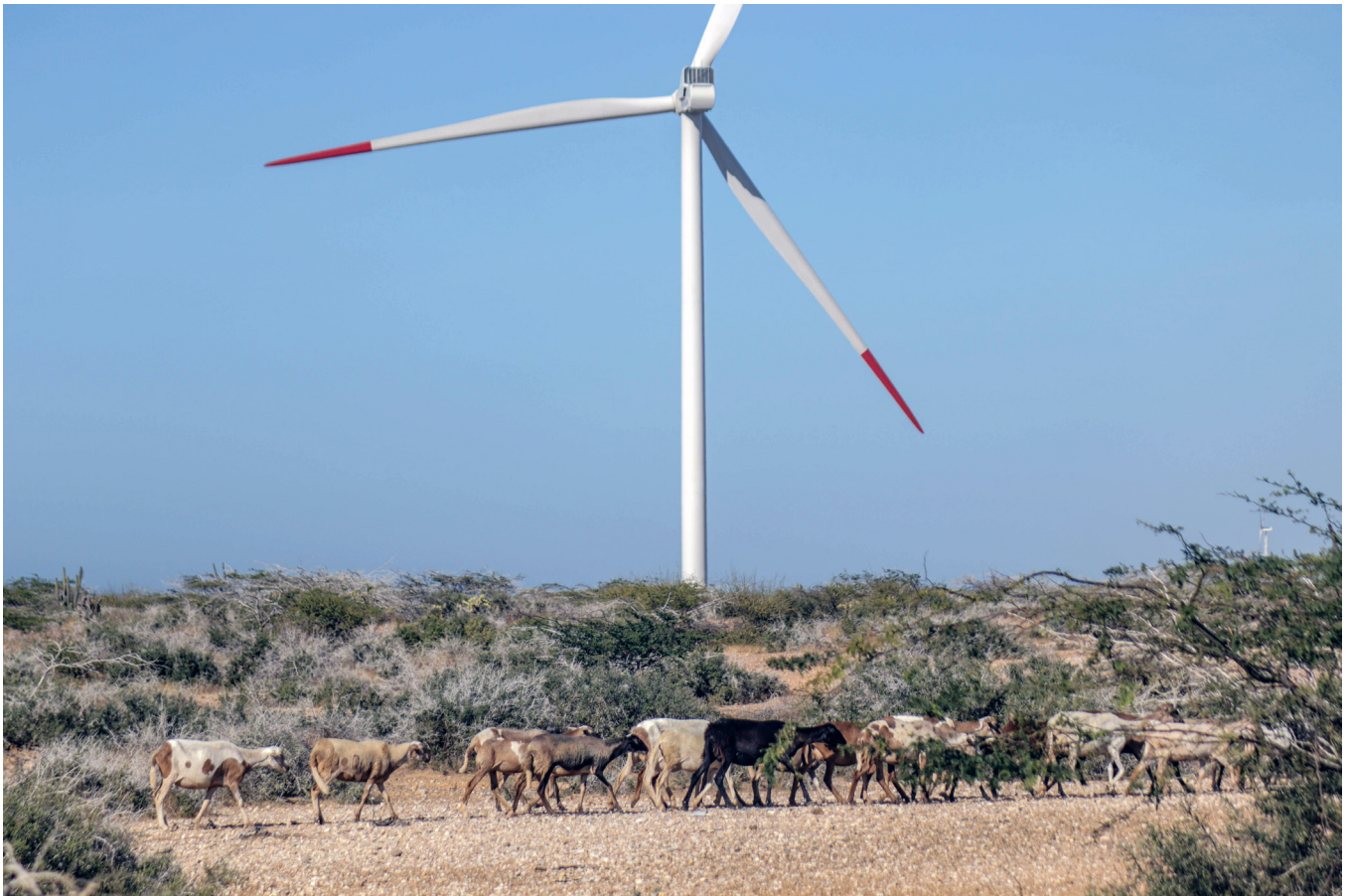
Chivos en los alrededores del parque eólico Guajira 1