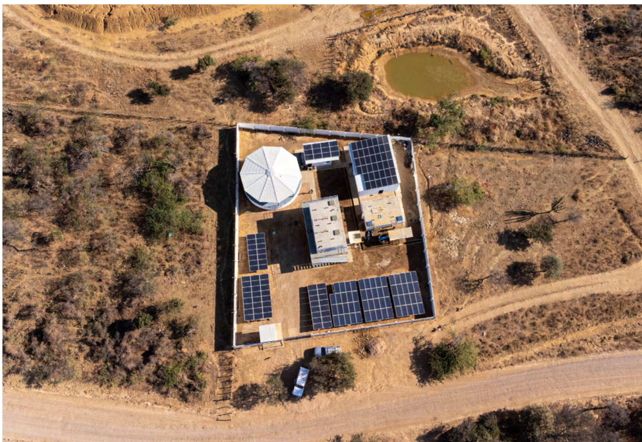
Sistema de abastecimiento de agua Wuimpalaa en el Municipio de Maicao, La Guajira

ampliar y robustecer los SSCC y atributos de estabilidad explícitamente valorizados; habilitar la participación de nuevas tecnologías ; y fortalecer la planeación como guía efectiva de la expansión . Al alinear estos elementos, Colombia podrá facilitar una penetración óptima de fuentes renovables, garantizar la operabilidad del sistema bajo cualquier condición hidrológica, resguardar la seguridad energética y asegurar que los beneficios de la transición energética se distribuyan de manera equilibrada. La oportunidad es estratégica: actualizar el marco hoy permitirá que la expansión futura ocurra sobre bases sólidas, eficientes y sostenibles.